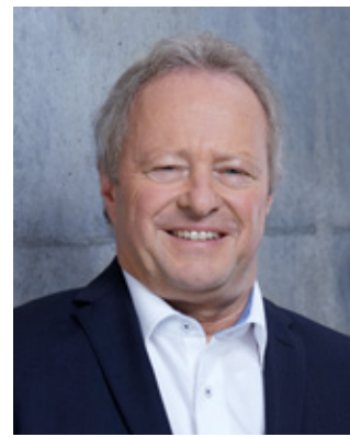
Prof. Dr.-Ing Dr.